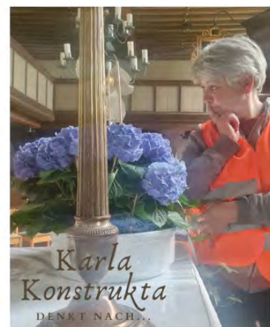
Text und Fotos: Karin Bruder